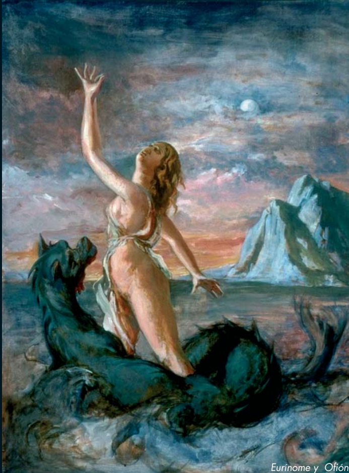
Eurínome y Ofión

“En el principio Eurínome, la Diosa de todas las cosas, surgió desnuda del Caos, pero no encontró nada sólido en que apoyar los pies y, a causa de ello, separó el mar del firmamento y danzó solitaria sobre sus olas en dirección sur, y el viento Norte llamado también Bóreas, puesto en movimiento tras ella, le sugirió que sería un buen instrumento para iniciar una obra Creadora. Eurínome se dio entonces la vuelta y se apoderó de aquél y lo frotó entre sus manos hasta que dio origen a la enorme serpiente Ofión. A continuación la diosa, que tenía frío, bailó para calentarse cada vez más agitadamente, despertando el deseo carnal en Ofión, quien sin pensarlo tres veces se enroscó el cuerpo de Eurínome y la poseyó con lujurioso deleite. Así fue como Eurínome quedó encinta. Después se transformó en paloma y se posó sobre las olas y a su debido tiempo puso el Huevo Universal. A petición suya Ofión se enroscó siete veces alrededor del huevo hasta que se empolló y dividió en dos. De él salieron todos los seres y elementos que componen el Cosmos: el sol, la luna, las estrellas, la tierra con sus montañas, ríos, mares y lagos, sus árboles, hierbas y criaturas vivientes...”